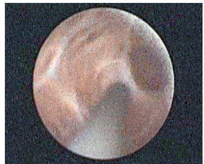
生理盐水冲洗后清澈的精囊