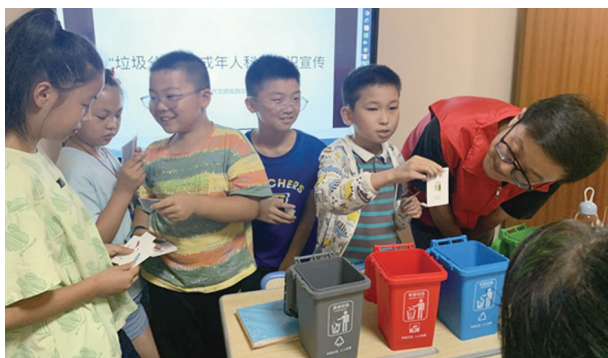
近日,健康路街道尚友社区联合小红帽文艺乐园开展未成年人垃圾分类科普知识活动。

“每天的服务时间原则上从早上9点到下午5点,为加强食品安全保障,托管服务不提供午餐服务,家长可以给孩子准备午餐带过来或者中午送过来,社区有微波炉可以加热。”庄泉社区相关负责人介绍。